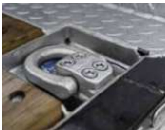
Versenkte 10 t Zurrpunkte