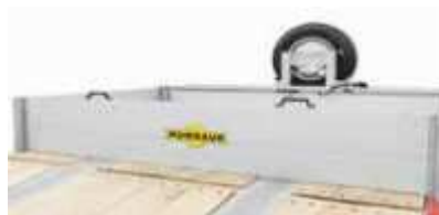
Aluminium-Bordwände für Hochplateau