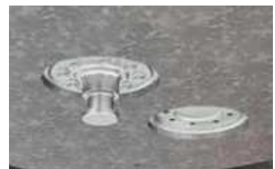
2 Positionen für Königszapfen