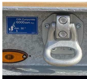
Schraubbare und nachrüstbare Zurringe