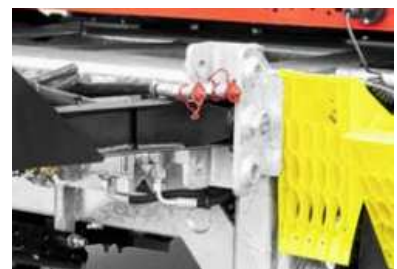
3 Lagerpositionen für die Zugdeichsel

*Sicherheitshinweis! Die Verwendung der Anhänger darf nur unter ausdrücklicher Beachtung aller straßenverkehrsrechtlichen, berufsgenossenschaftlichen und ladungssicherungstechnischen Vorschriften erfolgen. Alle Angaben ohne Gewähr! Für Irrtümer und Druckfehler wird keine Haftung übernommen. Technische Änderungen vorbehalten. Alle Maßangaben sind ca. Werte und beziehen sich auf das Serienfahrzeug ohne Zubehör. Zusatzausstattung verändert das Eigengewicht und die Nutzlast. Abbildungen ähnlich, können aufpreispflichtiges Zubehör enthalten.