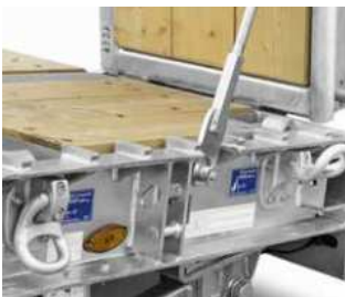
Kletterleisten am Außenrahmen im Bereich der Auffahrtsschräge