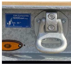
Schraubbare und nachrüstbare Zurringe