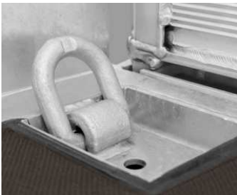
Zurrpunkte 6t im Brückenboden versenkt