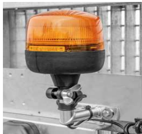
Rundumleuchte an der Rampe, optional